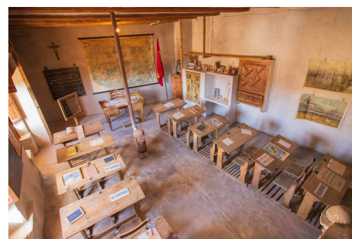
Escuela de Cañada de Benatanduz (Maestrazgo)