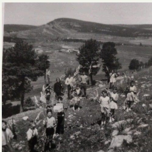
Alumnado de la escuela unitaria y mixta "San Bernabé" en Puertomingalvo.