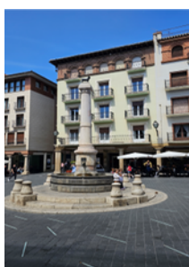
Plaza del Torico (Teruel)