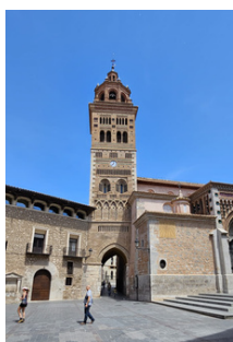
Torre de la catedral de Santa María de Mediavilla (Teruel).