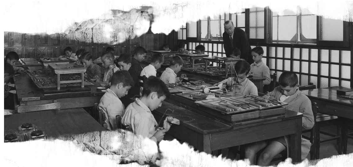
Clase de trabajos manuales en el Grupo Escolar Cervantes, 1933.

Este ideal de la educación integral implicó la aparición de otros usos del espacio escolar desconocidos hasta este momento. La nueva organización del currículo marcó tiempos para el recreo y los juegos infantiles, y así surgieron los patios. Aparecieron otros espacios y, sobre todo, se crearon los comedores escolares, que transformaron la imagen que de la escuela pública tenían las familias y la sociedad.