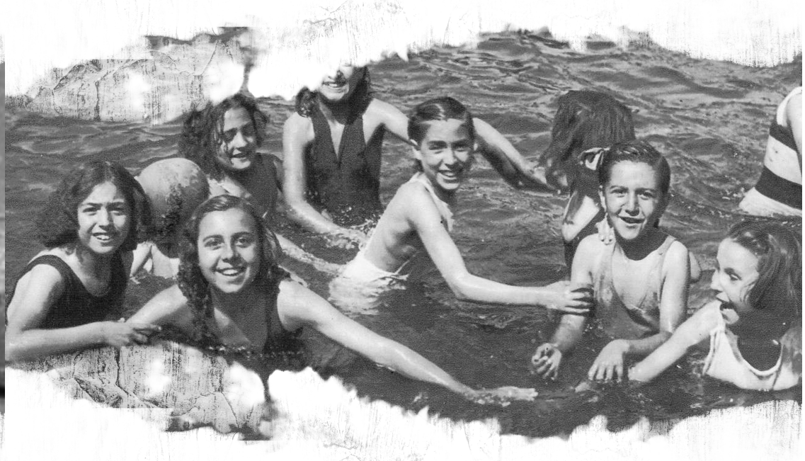
Grupo Escolar Lope de Vega.

Así van apareciendo los gabinetes médicos, los espacios para baños y duchas y las piscinas que se convirtieron en un espacio fundamental en todos los diseños arquitectónicos de la etapa republicana.