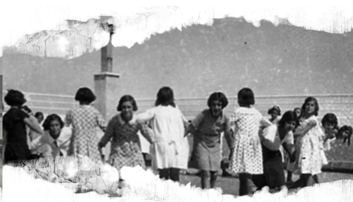
Grupo Escolar Alfredo Calderón (entre 1933 y 1935).

En Madrid, todas las nuevas construcciones escolares tuvieron patios , en los que se realizaban los juegos y los ejercicios físicos. También se acondicionaron las azoteas para el esparcimiento de los niños y niñas; así como para clases al aire libre. Y las galerías y zonas de paso se habilitaron como espacios de actividad libre.