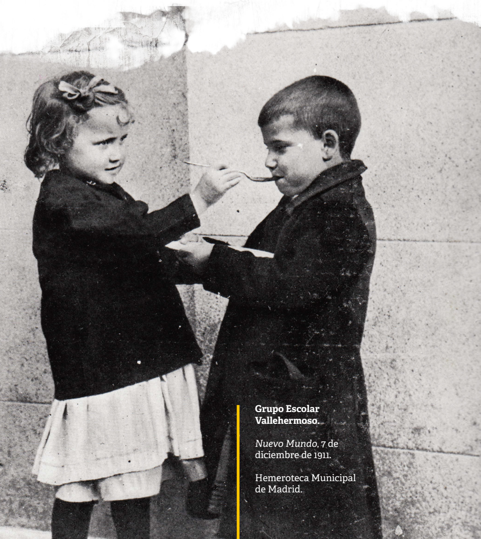
Grupo Escolar Vallehermoso.

Ante el "desastre" de 1898 muchos regeneracionistas se dejaron llevar por el pesimismo y pensaron que esta crisis significaba el fin de la nación. Pero otros aportaron soluciones. La mayoría apuntó a la educación como una de las vías para salvar a España, creyeron en su papel como motor de cambio social. Y soñaron con una escuela primaria que transformaría la "España vieja" en la "España nueva". Así se inició el proceso de reforma pedagógica más intenso que se ha vivido en nuestro país.