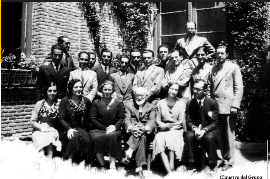
Claustro del Grupo Escolar Cervantes en la etapa republicana.